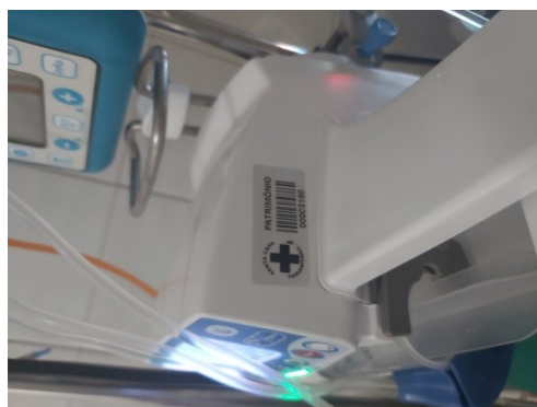
n. patrimônio 3180