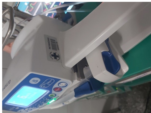
n. patrimônio 3178

CNPJ: 72.127.210/0001-56 – Inscr. Est. 684.113.679.114 – CREMESP 01150 – CNAS – PROC 000002192922/1968-00 Declarada de Utilidade Pública pelo D. Federal 64.831 – 16/07/1969, D. Estadual 6.197 – 22/05/1975, Lei Mun. 824/67 e 467/62 http://www.santacasatq.com.br | E-mail: stacasatq@terra.com.br