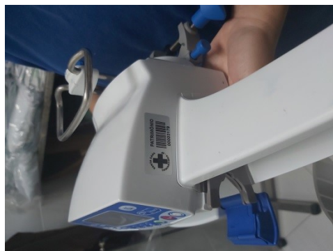
n. patrimônio 3179