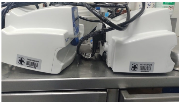
n. patrimônio 3182 e 3183