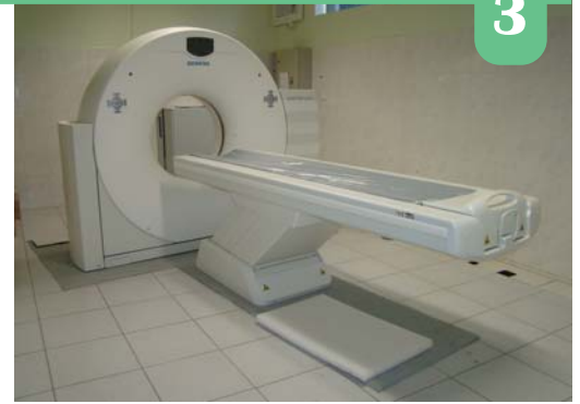
O tomógrafo da Santa Casa, no dia em que chegou e montado em sala apropriada no CEDISC, no mês de fevereiro